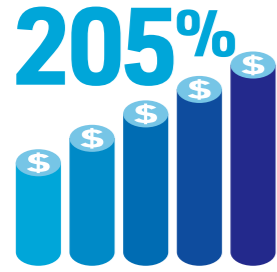
直近10年間の成長率