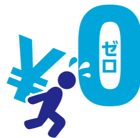
創業以来借り入れ無し